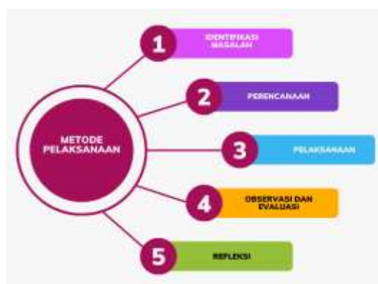
Gambar 1. Diagram Alur Participatory Action Research (PAR)

Pelaksanaan kegiatan mengacu pada siklus PAR yang terdiri dari beberapa tahapan, yaitu identifikasi masalah, perencanaan, pelaksanaan tindakan, observasi dan evaluasi, serta refleksi. Tahap identifikasi masalah dilakukan melalui observasi lapangan dan wawancara dengan pelaku UMKM untuk menggali kebutuhan, kendala, dan potensi yang dimiliki, khususnya dalam aspek literasi digital dan produksi media promosi. Berdasarkan hasil identifikasi tersebut, tahap perencanaan dilakukan dengan menyusun desain pelatihan produksi video feature yang mencakup materi praproduksi, produksi, dan pascaproduksi. Materi yang diberikan meliputi konsep dasar video feature, penyusunan naskah ( storyline dan storyboard ), teknik pengambilan gambar seperti framing , komposisi, dan sudut pengambilan gambar, teknik camera movement ( pan , tilt , dolly , dan tracking ), serta editing video menggunakan perangkat lunak sederhana yang mudah diakses oleh mitra.