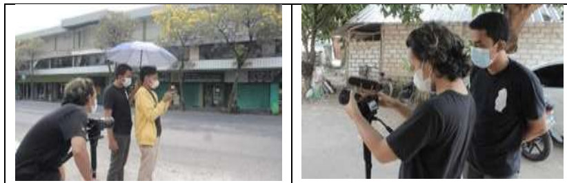
Gambar 2. Pengambilan gambar di Warung Becek Menthok Sor Sawo

Gambar 2, memperlihatkan aktivitas produksi konten audiovisual yang dilakukan di ruang terbuka sebagai bagian dari proses pendampingan UMKM dalam penguatan strategi promosi digital. Terlihat tiga orang terlibat dalam proses pengambilan gambar, yang masing-masing memiliki peran berbeda, yaitu sebagai kameramen, talent, dan kru pendukung. Kameramen menggunakan kamera profesional untuk merekam visual, sementara talent memanfaatkan perangkat telepon genggam sebagai bagian dari simulasi pembuatan konten digital. Selain itu, salah satu anggota tim memegang payung yang berfungsi sebagai alat bantu sederhana untuk mengontrol pencahayaan alami agar hasil visual lebih optimal. Kegiatan ini menunjukkan penerapan metode praktik langsung ( learning by doing ) dalam pelatihan produksi media audiovisual, khususnya bagi pelaku UMKM. Penggunaan peralatan yang relatif sederhana namun fungsional menegaskan bahwa produksi konten promosi tidak selalu memerlukan teknologi yang kompleks, melainkan dapat disesuaikan dengan sumber daya yang dimiliki.