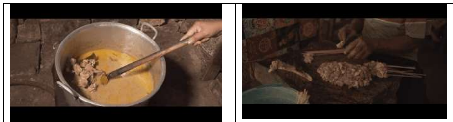
Gambar 3. Hasil Video Feature Becek Menthok Sor Sawo Kabupaten Tuban

ditampilkan visual seorang talent yang sedang berbicara, yang mengindikasikan adanya sinkronisasi antara elemen audio dan visual. Hal ini mencerminkan proses editing yang bertujuan untuk menghasilkan kualitas konten yang lebih komunikatif dan profesional.