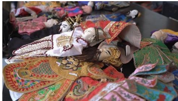
Gambar. 3.5 Karakter Wayang Potehi

Menampilkan koleksi artefak sejarah yang berkaitan dengan Wayang Potehi dan budaya Tionghoa di Gudo, Jombang. Footage dari Museum Gudo akan digunakan dalam bagian awal dokumenter sebagai latar belakang sejarah Wayang Potehi di Jombang. Footage dari Klenteng Hong San Kiong akan memperkaya segmen tentang pementasan dan komunitas penggiat Wayang Potehi, serta memberikan visual yang lebih mendalam tentang hubungan antara seni pertunjukan ini dengan tradisi keagamaan. Kombinasi kedua lokasi ini akan menciptakan alur dokumenter yang lebih kuat, menghubungkan aspek sejarah dengan kehidupan modern Wayang Potehi di Jombang.