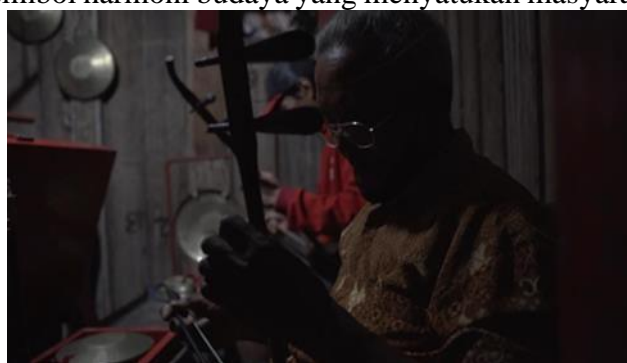
Gambar 3.4 Pementasan

Hari ketiga tepatnya pada Minggu 7 Agustus 2022, kami melakukan pengambilan gambar pada saat pementasan wayang potehi di Klenteng Hong San Kiong Jombang dari Siang hingga malam. Wayang Potehi merupakan salah satu bentuk seni pertunjukan khas Tionghoa yang telah berkembang di Indonesia selama ratusan tahun. Klenteng Hong San Kiong di Gudo, Jombang, dikenal sebagai salah satu pusat utama pementasan Wayang Potehi di Indonesia. Klenteng ini menjadi saksi hidup bagaimana kesenian ini tetap lestari di tengah perubahan zaman. Klenteng Hong San Kiong telah menjadi rumah bagi Wayang Potehi selama beberapa dekade. Pementasan di klenteng ini tidak hanya menjadi bagian dari ritual keagamaan, tetapi juga sarana hiburan dan edukasi bagi masyarakat. Seiring waktu, pertunjukan Wayang Potehi di tempat ini mengalami berbagai perkembangan, baik dari segi cerita, teknik pementasan, maupun pemanfaatan media digital. Setiap tahunnya, pertunjukan Wayang Potehi di Klenteng Hong San Kiong selalu dinantikan oleh masyarakat, terutama dalam perayaan Imlek dan ritual penghormatan kepada dewa-dewa. Pementasan ini menjadi simbol harmoni budaya yang menyatukan masyarakat lintas etnis dan agama.