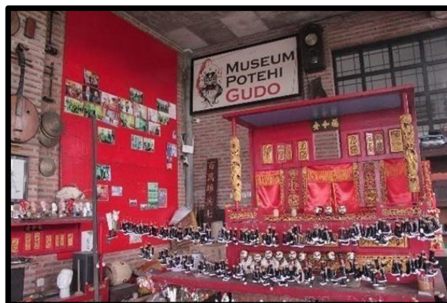
Gambar 2.1 Museum Potehi

Selain itu, evaluasi dilakukan untuk memastikan bahwa semua tahap dari awal hingga pra-produksi telah dilakukan dengan benar. Jika ditemukan ketidaksesuaian atau kegagalan, perbaikan akan dilakukan. Proses akan dilanjutkan ke tahap produksi jika semua sudah sesuai. Kami membagi proses produksi menjadi dua bagian: produksi gambar dan suara, yang dilakukan di tempat yang telah ditetapkan dengan narasumber. Tahap pasca-produksi dimulai setelah pengambilan gambar dan suara selesai. Di sini, pengeditan gambar, suara, penambahan efek, dan rendering dilakukan. Setelah semua prosedur selesai, sutradara akan memeriksa hasil penyuntingan untuk memastikan bahwa mereka sesuai dengan naskah yang ditulis.