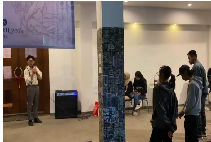
Gambar 5. Sambutan sebelum pembukaan Pameran

Dalam sambutannya, menyampaikan terima kasih pada pihak pimpinan Galeri Raos Kota Batu yang telah memberikan izin kepada tim untuk menyelenggarakan pameran seni kontemporer dengan tajuk Fenomeart serta para pengunjung penikmat seni. Sambutan selanjutnya disampaikan oleh Mitra Call Artsrik, beliau menyampaikan pentingnya berkarya pada tantangan zaman yang semakin kuat dengan perkembangan teknologi, dimana AI mampu merekonstruksi segala hal. Beliau berpesan seniman terutama seniman muda untuk selalu berkarya serta menciptakan wadah yang menampung ide kreatif dan inovatif. Serta ucapan terima kasih kepada Tim Lembaga Penelitian dan Pengabdian kepada Masyarakat Universitas Negeri Malang (LPPM UM 2024).