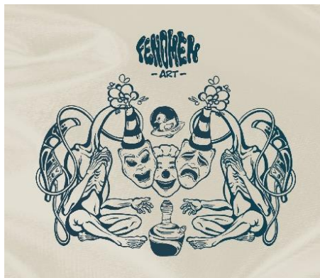
Gambar 4. Maskot Sekaligus Logo Pameran Fenomeart

Pameran seni pada Pengabdian Mahasiswa yang di selenggarakan Lembaga Penelitian dan Pengabdian kepada Masyarakat Universitas Negeri Malang (LPPM UM 2024) ini mengangkat tentang Sebuah fenomena sosial yang terjadi di era saat ini. Seniman dalam berkarya selalu merespon permasalahan yang dekat dengan diri.