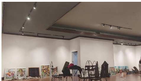
Gambar 1. Penyeleksian Karya Pameran