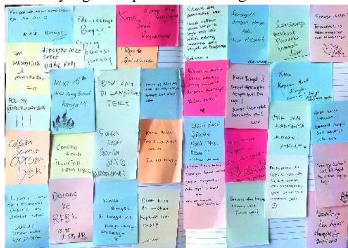
Gambar 14. Kritik dan Saran Pengunjung

Pameran wajib memiliki sebuah gagasan konsep nilai, apa yang akan diangkat dalam sebuah pameran tersebut, sebelum nantinya pameran tersebut di buka kepada publik. Agar nantinya pameran tidak hanya sebuah ruang yang hanya di gunakan untuk memajang sebuah karya. Para pengunjung/masyarakat menikmati secara langsung, ikut merasakan perasaan estetik baru, sekaligus mendapatkan edukasi mengenai perkembangan seni global. Berdasarkan pendapat pengunjung mengenai pameran Fenomeart ini mampu menciptakan wadah yang sesuai dengan konsep dan nilai yang ingin disampaikan. Hal ini dibuktikan juga kritik dan saran pengunjung pada note yang ditempelkan di dinding