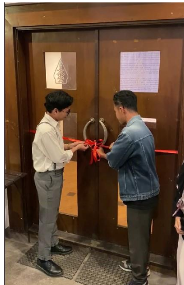
Gambar 6. Pemotongan pita sekaligus pembukaan Pameran Fenomeart

Setelah dilaksanakan grand opening dan sambutan, dilanjut dengan pemotongan pita di depan pintu pameran Fenomeart sebagai seremonial dibukanya pameran tersebut.