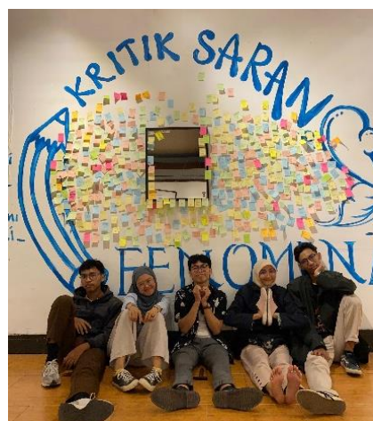
Gambar 11. Dinding Kritik dan Saran