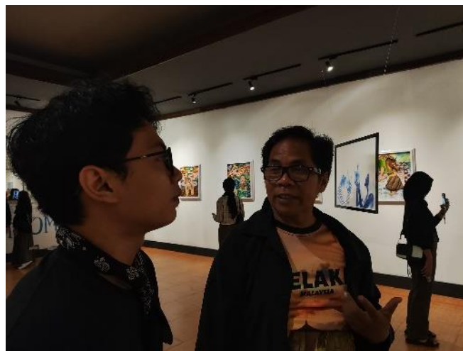
Gambar 13. Bedah Karya dan Diskusi