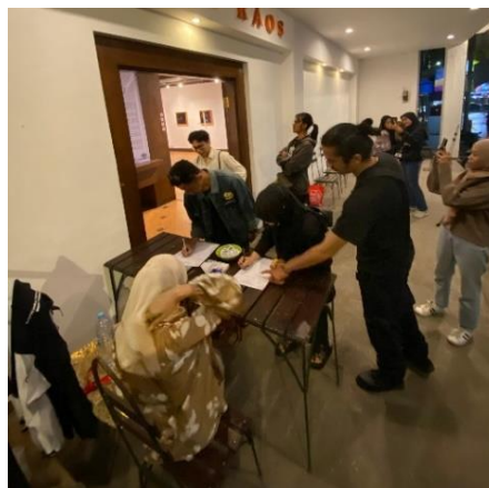
Gambar 3. Komunitas Seni Kota Malang-Batu