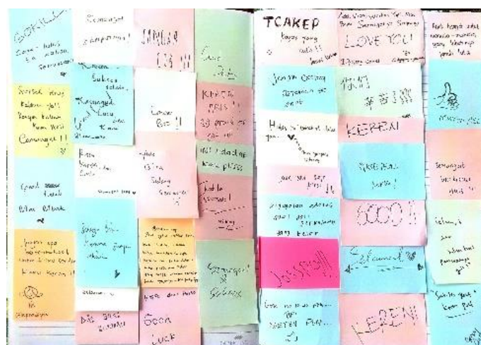
Gambar 15. Kritik dan Saran Pengunjung