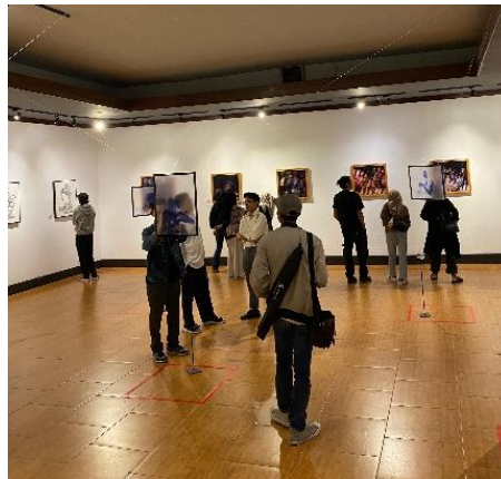
Gambar 9. Pameran Fenomeart

Pameran ini terpajang 50 karya Lukis dengan media teknik yang beragam. dalam setiap rute memiliki spot yang unik, selain pengunjung dapat menikmati karya seni surealisme dalam sebuah konsep dan ide, pengunjung juga dapat berfoto alah-alah foto kekinian atau Instagram mable .