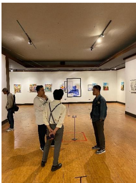
Gambar 8. Pameran Fenomeart