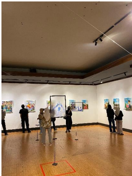
Gambar 7. Pameran Fenomeart

Pameran ini dibuka dari jam 09.00-21.00 WIB selama lima hari. Dalam pendisplayan pameran ini melibatkan visual kontemporer kekinian dan baru, dari cara menikmati karya seni yang menggunakan arah perspektif mata dari kanan dan kiri, bahkan ada yang menggunakan fitur scan pada ponsel pengunjung.