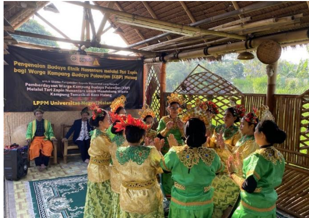
Gambar 4. Simulasi penerimaan tamu dengan tampilan tari Zapin

pertunjukan, penari juga memperhatikan aspek penampilan, mulai dari pakaian adat yang dikenakan hingga tata rias yang digunakan. Pakaian yang indah dan berwarna-warni mencerminkan kekayaan budaya lokal yang khas.