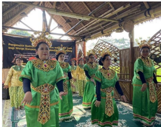
Gambar 3. Pementasan pada akhir kegiatan pelatihan

Pelatihan Tari Zapin di Kampung Budaya Polowijen (KBP) melibatkan perempuan-perempuan lokal yang memiliki semangat untuk melestarikan budaya. Mereka dilatih untuk menguasai gerakan tari dengan baik, serta memahami nilai-nilai yang terkandung dalam setiap gerakannya. Proses pelatihan ini dilakukan secara rutin, dengan sesi latihan yang diadakan seminggu sekali. Melalui pelatihan ini, para penari tidak hanya belajar tentang tari, tetapi juga membangun rasa kebersamaan dan identitas budaya yang kuat. Keterlibatan komunitas dalam pertunjukan ini menciptakan rasa memiliki dan tanggung jawab terhadap pelestarian budaya lokal.